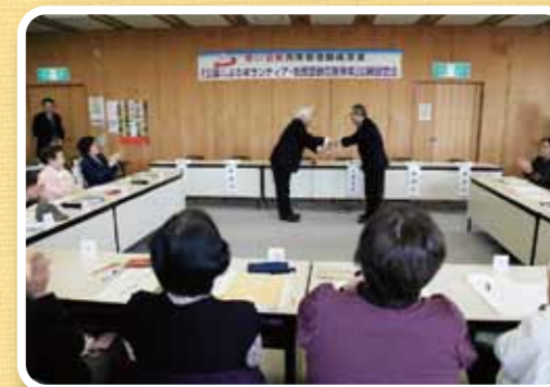
モデル事業助成金の贈呈