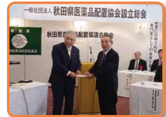
●東日本大震災義援金へ 300,000 円 一般社団法人 秋田県医薬品配置協会 様