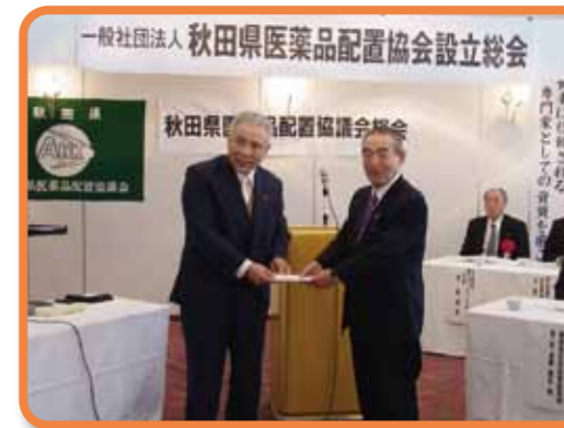
●東日本大震災義援金へ 300,000 円 一般社団法人 秋田県医薬品配置協会 様