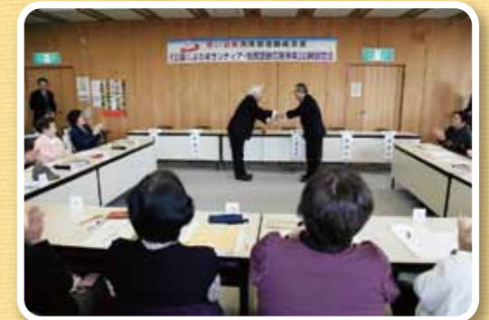
モデル事業助成金の贈呈