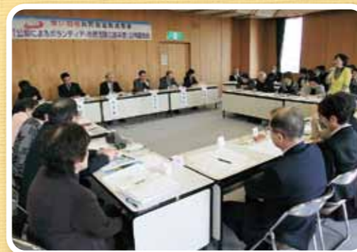
申請団体による発表の様子

共同募金の使いみちの透明性を高めることで、県民の皆さんの共同募金への理解を高めることにつながる素晴らしい取り組みですので、今後こうした取り組みを県内で広く進めたいと考えています。