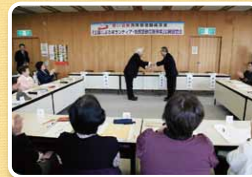
モデル事業助成金の贈呈